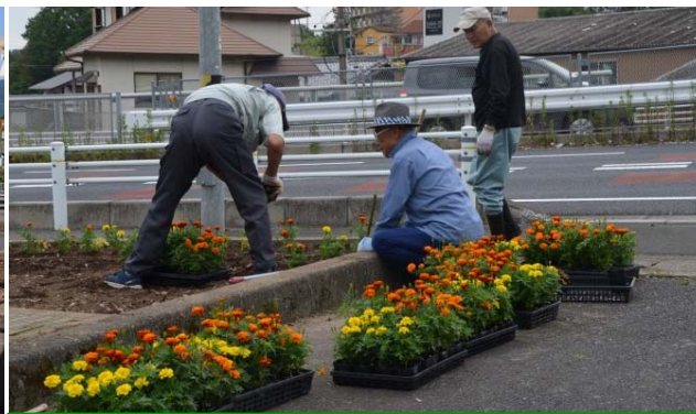
今回は、コリウスとマリーゴールド350株。