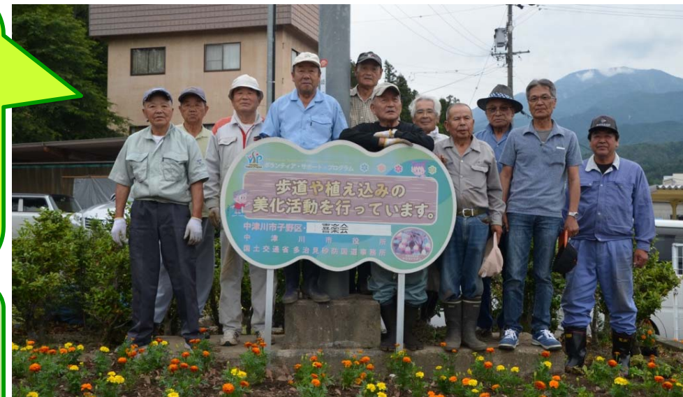
皆さん、お暑い中お疲れ様でした。

ボランティアサポートプログラムとは、地域住民の方々や企業等が実施団体となり、地元自治体と道路管理者が協力して道路の清掃・植栽の管理等を行い、地域にふさわしい道づくりを進めることを目的とした取り組みです。