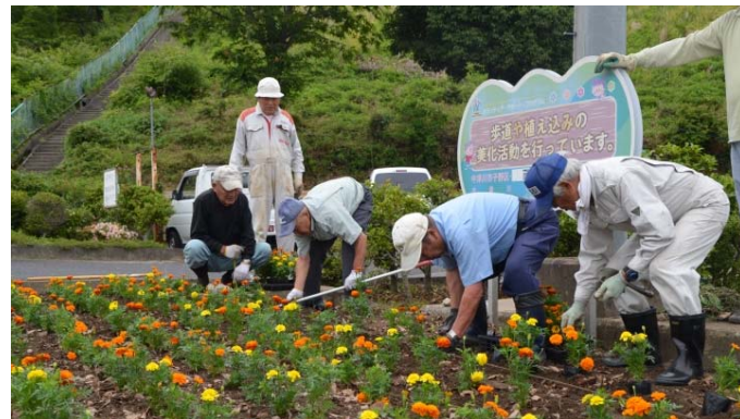
ひもで配置を決めて、きれいに植えます。