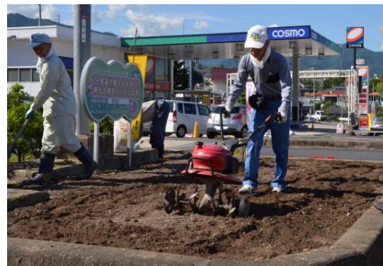
耕耘機で土作りをします。

令和元年6月14日(金)午後、一般国道19号岐阜県中津川市子野交差点付近で、子野区「子野喜楽会」の皆さんがボランティア・サポート・プログラム活動として、花壇の整備、除草作業、清掃活動等を実施されました。当初予定の6月15日(土)が大雨予報のため、1日早めての活動でしたが、楽しい作業となりました。