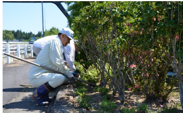
植木の下に芝桜を植えました。

平成29年6月15日(木)朝8時より、一般国道19号岐阜県中津川市子野交差点付近で、「子野区」と「子野喜楽会」の皆さんがボランティア・サポート・プログラム活動として、花壇の整備、除草作業、清掃活動等を実施されました。今年は「ベゴニア」の苗が新しく加わり、花の配置にもこだわりました。