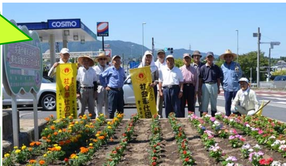
お疲れ様でした。左からマリーゴールド、サルビア、日々草、ベゴニア

ボランティアサポートプログラムとは、地域住民の方々や企業等が実施団体となり、地元自治体と道路管理者が協力して道路の清掃・植栽の管理等を行い、地域にふさわしい道づくりを進めることを目的とした取り組みです。