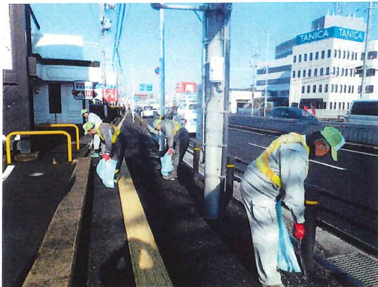
国道19号線 下り車線歩道部 清掃作業状況