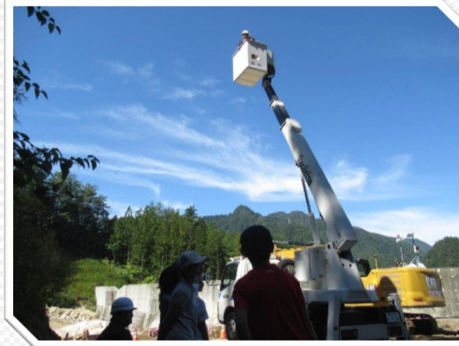
建設機械への乗車体験をしました