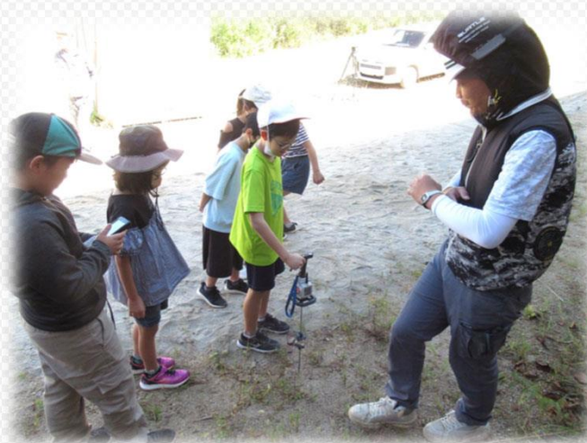
測量の体験をしました