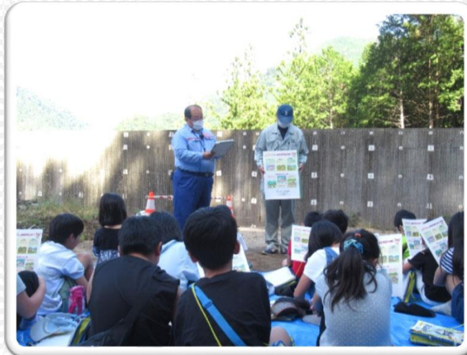
砂防施設と土石流の話を知りました

★令和5年9月25日（月）大桑村立 大桑小学校4年生のみなさんに『砂防教室』を開催しました。