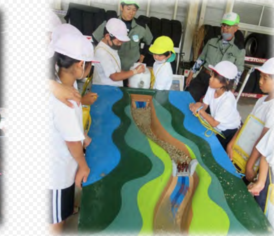
土石流模型実験を体験しました