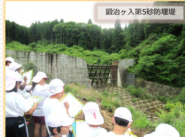
鍛冶ヶ入第5砂防堰堤