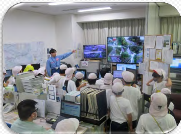
道路センターの役割を学びました