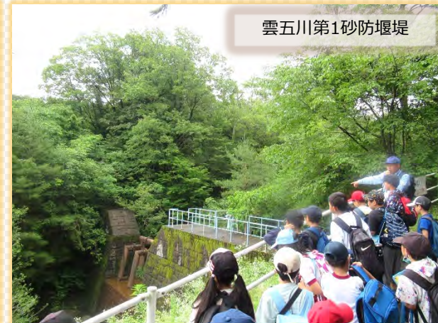
雲五川第1砂防堰堤