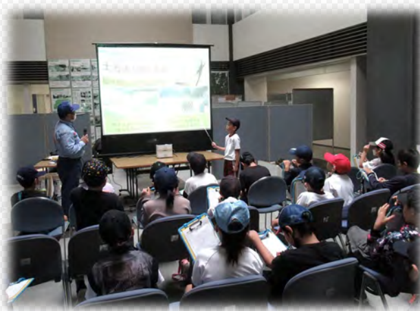
砂防施設と土石流の話を知りました

★令和5年6月23日（金）多治見市立市之倉小学校・笠原小学校4年生のみなさんに『砂防教室』を開催しました。