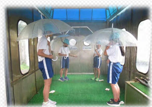
降雨体験機で20mm,50mm,120mmの雨を体験しました