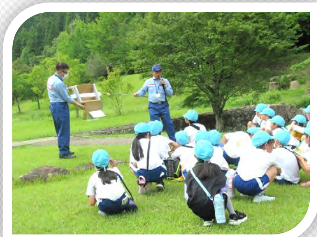
砂防施設（雲五川床固工群）の見学をしました