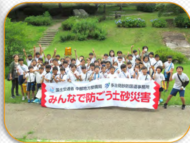
養正小学校4年生のみなさん