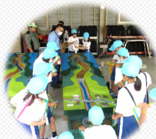
土石流模型実験を体験しました