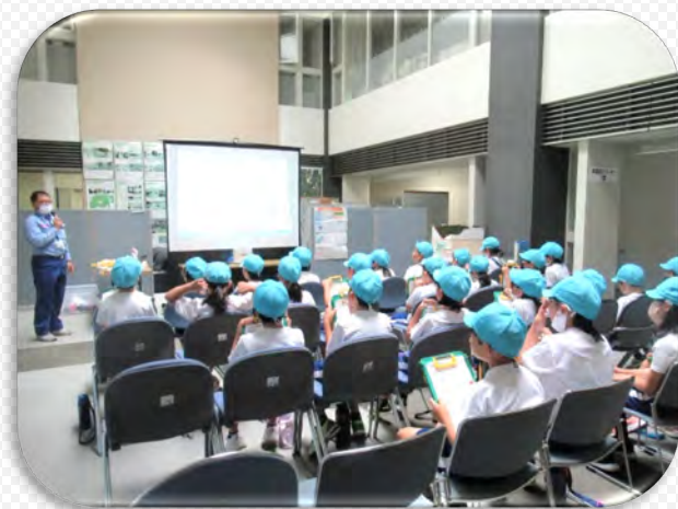
砂防施設や土石流の話を知りました

★令和5年6月20日（火）多治見市立養正小学校4年生のみなさんに『砂防教室』を開催しました。