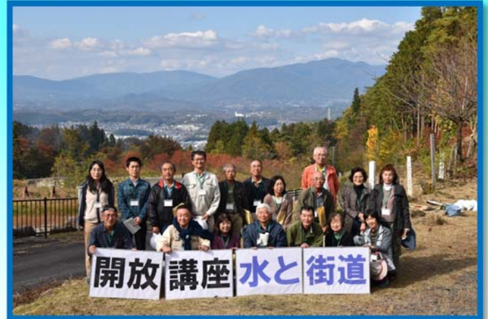
四ツ目川遊砂工と中津川市街地をバックに記念撮影

昭和7年に発生した『四ツ目川災害』と四ツ目川遊砂工の機能(施設面積13ha、床固工12基、施設効果量20万m3)等について説明していただきました。