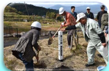
記念植樹も行いました～♪