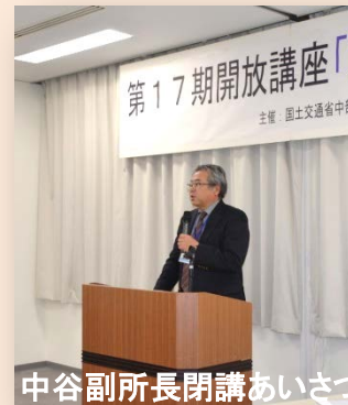
中谷副所長閉講あいさつ