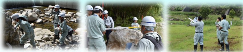
牛ヶ瀬砂防堰堤(岩判定) 中津川第2砂防堰堤(礫径調査) 四ツ目川遊砂工

(AM) 牛ヶ瀬砂防堰堤(岩判定)・中津川第2砂防堰堤(巨石の礫径調査)・ 四ツ目川遊砂工・苗木城址 (PM) 南木曾町博物館(講話)・梨子沢土石流災害復旧関連施設