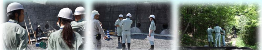
草口第1砂防堰堤 方月第1砂防堰堤 虎溪山山腹工