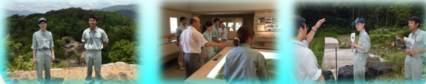
苗木城址 南木曾町博物館 梨子沢災害復旧