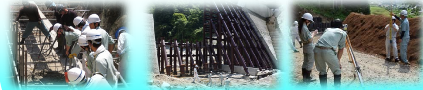
桜洞砂防堰堤(生コン打設) 越百川第3砂防堰堤 下洞沢砂防堰堤(測量)