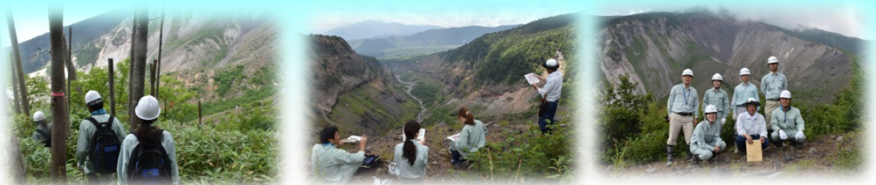
御嶽山西部地震崩壊地現地調査 伝上崩れの前にて