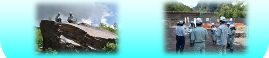
土石流によって押し上げられた巨石の上にて 濁沢川治山ダム工事現場