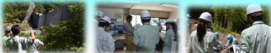
滑川第1砂防堰堤 桜洞砂防堰堤(プラント生コン生成) 桜洞砂防堰堤(生コン受入検査)

(AM) 滑川第1砂防堰堤・桜洞砂防堰堤(コンクリート打設) (PM) 越百川第3砂防堰堤・下洞沢砂防堰堤(測量)