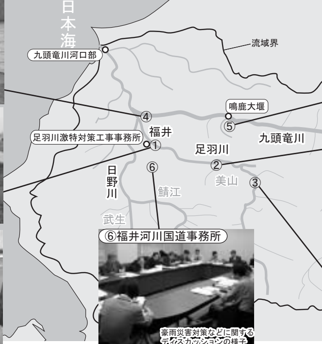
⑤わくわくRiverCAN 九頭竜川資料館