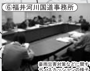
豪雨災害対策などに関するディスカッションの様子