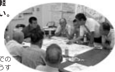
名古屋市北区での車座集会の様子

地元市町の御協力を得て、沿川学区の皆様などと土岐川庄内川についてざっくばらんな意見交換をさせていただきます。川ぞいにお住いの地区での、開催の御要望がありましたらお気軽にお声掛け下さい。