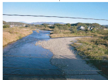
三共橋上流の風景