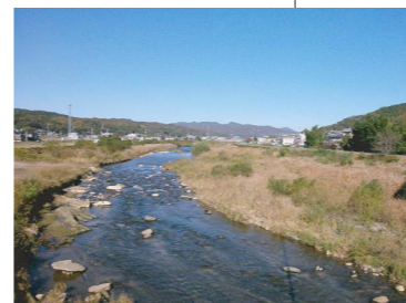
土岐橋付近の風景