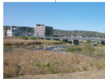
土岐橋付近の風景