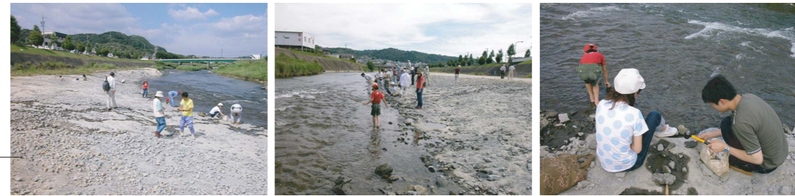
松ヶ瀬橋下流右岸の地層見学指定地：大勢の人が化石とりに楽しんでいる