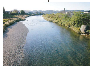
三共橋下流の風景 大きな石はどこからやってきた？