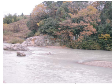
虎溪山永保寺付近の流れ