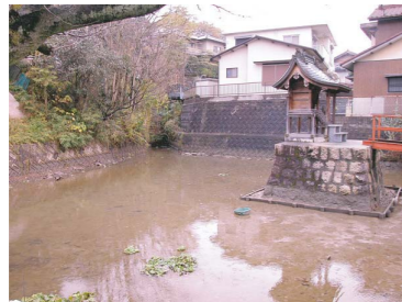
弁天池・虎溪用水