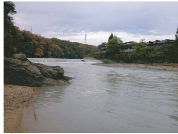
虎溪頭首エノワニ岩