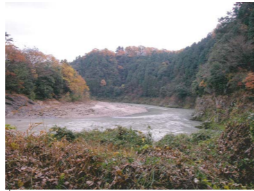
虎溪山永保寺付近の流れ