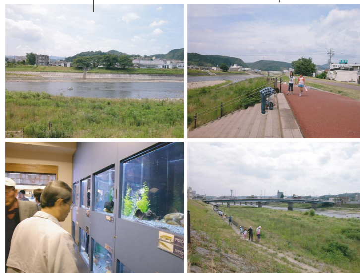
土岐川観察館と川の風景