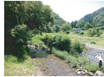
オオサンショウウオが生息する蛇ヶ洞川