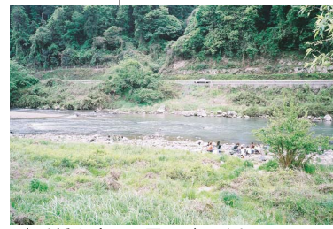
鹿乗橋上流の河原：パーベキュー