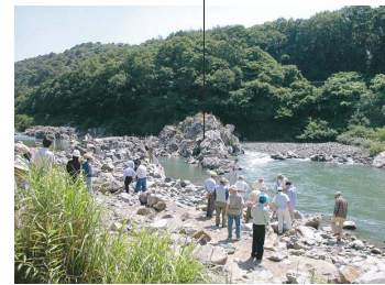
溪谷が美しい 軍艦岩