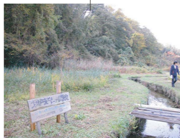
オ井戸流れ:きれいな湧き水が流れています。市民が手入れをしています。