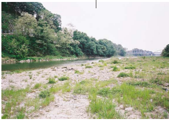
鹿乗橋下流の河原