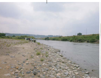
内津川合流点下流左岸のひろーい河原