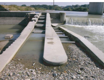
神明上条用水堰の魚道