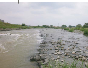
内津川合流点下流の流れ