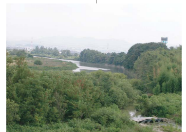
竜泉寺崖下の自然