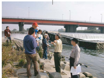
小田井床止の魚道について話し合う