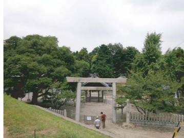
西八龍社 (カミナリ除け)