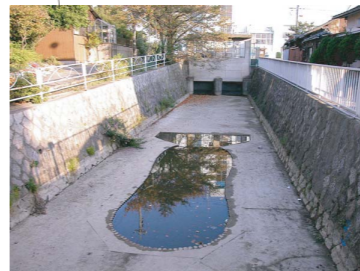
庄内用水に通年通水を