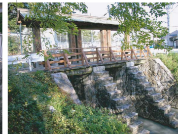
黒川樋門 (明治時代)