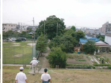
東八龍社 (カミナリ除け)