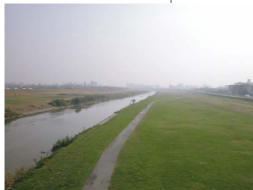
ビューポイント：ふれあい橋上流