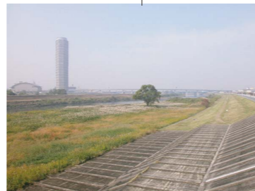
ビューポイント：ふれあい橋下流