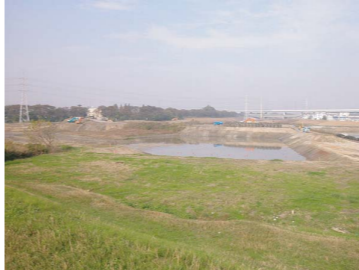
新川洗堰 新川洗堰遊水地