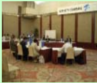
土岐川庄内川流域委員会の討議結果

コレカラプロジェクトレポートVol.2は、「庄内川水系河川整備計画【直轄管理区間】」の原案づくりにあたり、現状の課題やその課題を解決するための目標、その目標を実現化するための整備内容(メニュー)を分かりやすく示したものであり、流域委員会での討議結果や流域住民、流域自治体のご意見やご提案を受けて作成したものです。コレカラプロジェクトレポートVol.2の巻末に『 意見ハガキ 』を添付し、流域住民の方々等より意見聴取を行います。