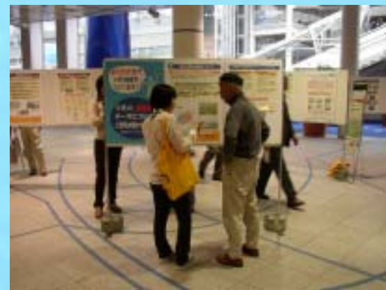
オープンハウスの様子