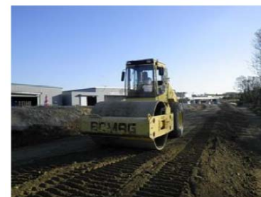
ローラによる締固め状況