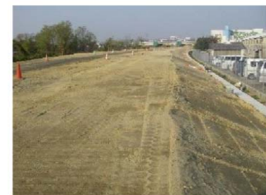
締固め後の盛土状況