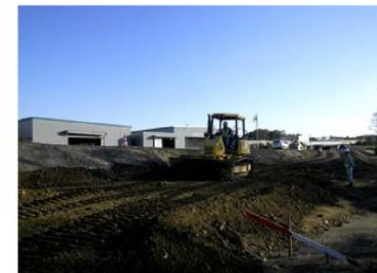
ブルドーザによる敷均状況