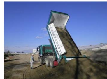
10トンダンプによる土砂投入状況