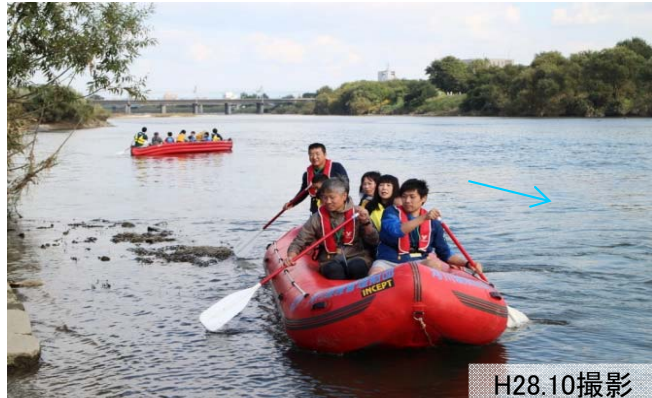
イベント「りばーぴあ庄内川」によるEボート体験