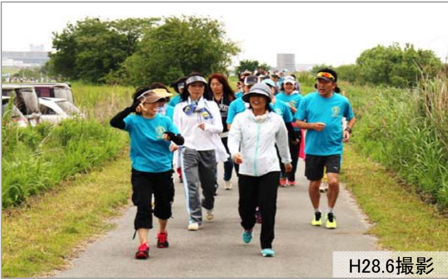
「庄内川水辺の散策路及び大治町庄内川河川敷公園」第2回ウォーキング