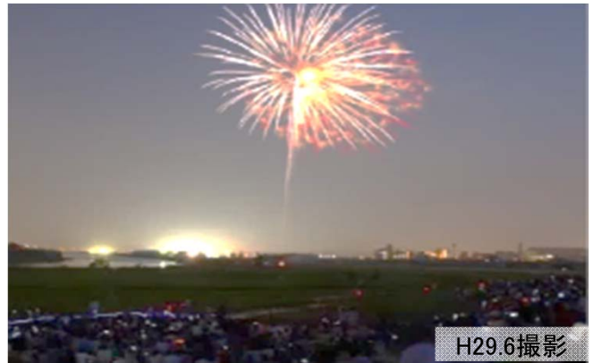
西枇杷島まつり(花火) 約22万人参加(平成29年度実績)