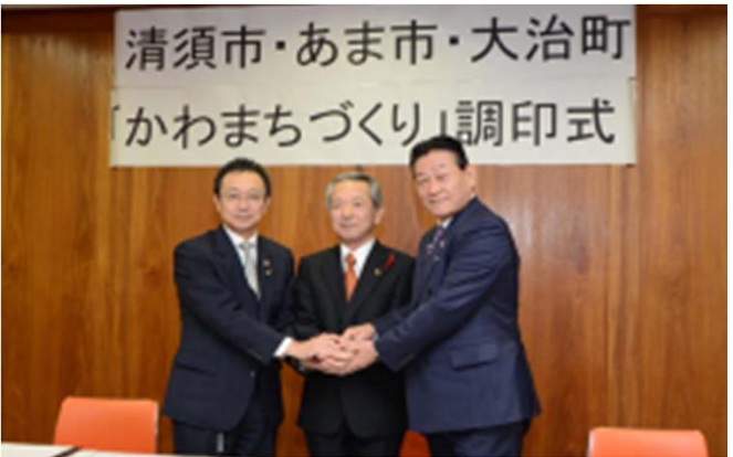
清須市・あま市・大治町 かわまちづくり協議会調印式