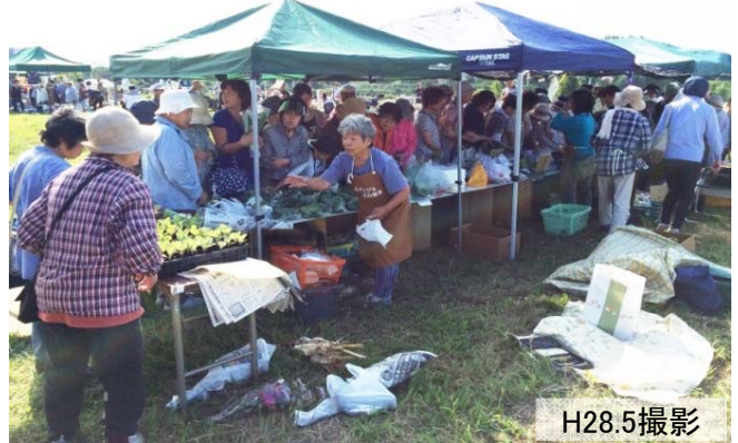
みずとぴあ庄内朝市の様子 (月1回の実施)