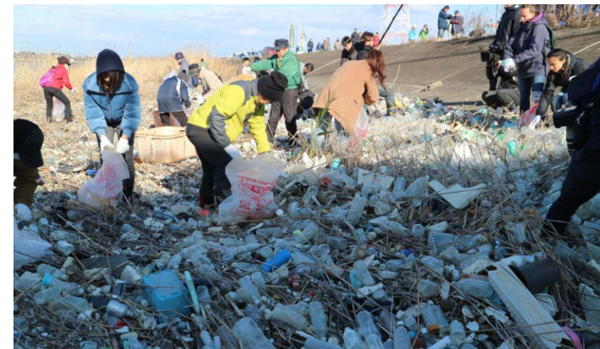
台風の高潮によりペットボトルが大量に漂着(平成30年秋 中堤会場)