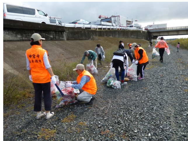
活動状況(平成30年秋 庄内川左岸 学区会場)