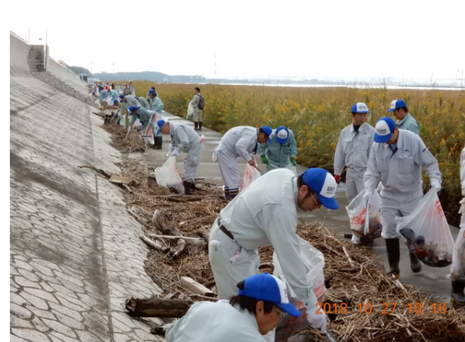
活動状況(平成30年秋 庄内川左岸 学区会場)