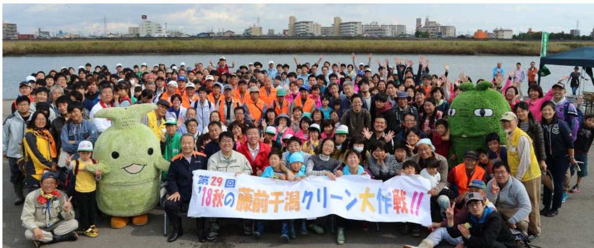
集合写真（平成30年 秋 中堤会場）