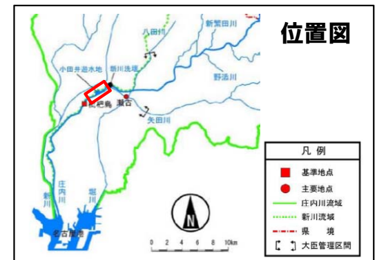
地図・空中写真閲覧サービス