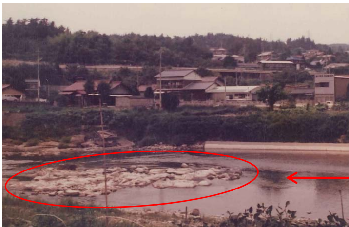
掘削前 撮影:昭和53年頃