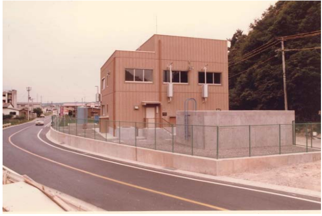
排水機場外観 撮影:S53