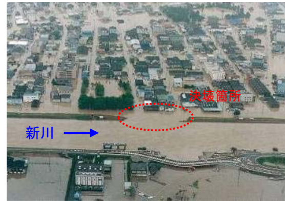
平成12年9月洪水（東海豪雨） 新川決壊地点の状況