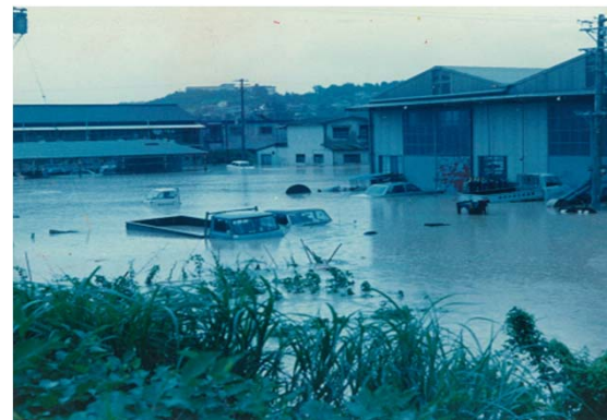
平成元年9月洪水（台風22号） 土岐小学校付近の状況