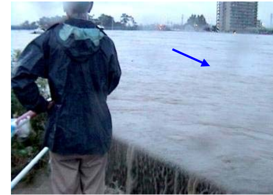
平成12年9月洪水（東海豪雨） 一色大橋付近の越水状況