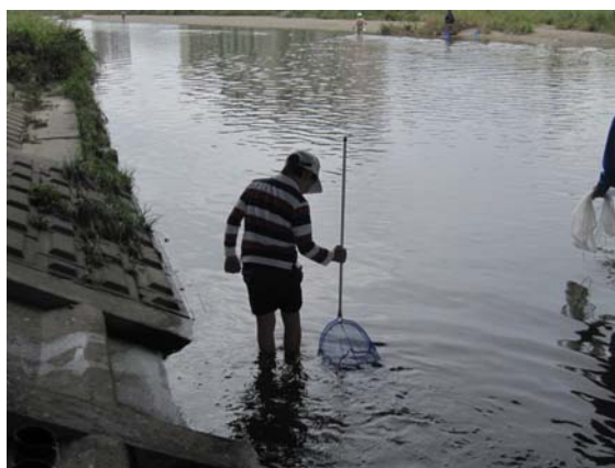
ガサガサ調査の状況

水質調査ではパックテストでCOD7(気温19℃)、透視度100cm以上でした。 矢田川に生息が確認されている約半分(12種類程度)の生物が観察されました。 (主な確認種:トウヨシノボリ、ウナギ、シマドジョウ、ニゴイ、メダカ、カダヤシ、オイカワ)