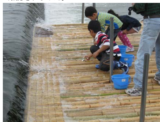
やなにかかったオイカワ

※設置制約時間(4時間)の中、厳しい調査結果となり、来年は川幅いっぱい長時間設置したいとの声がありました。