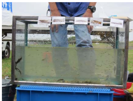
今回確認された生物(12種類程度)