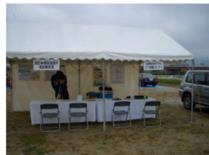
西日本電信電話(株)名古屋支店