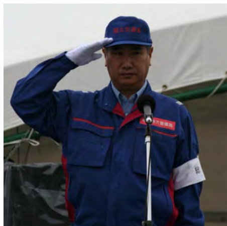
訓示 総裁 国土交通省中部地方整備局長