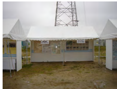
第四管区海上保安本部 国土交通省庄内川河川事務所