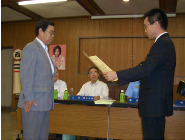
総指揮者(西区消防団連合会)