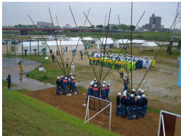
春日井市消防本部