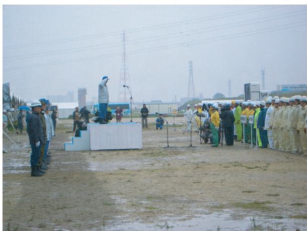
総指揮者 人員報告