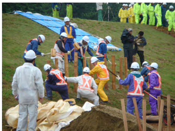
愛知県建設業協会、庄内川災害協力会