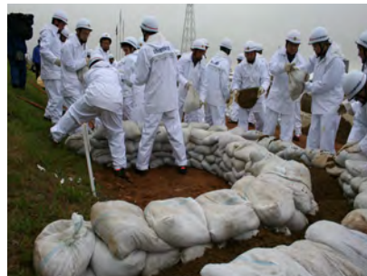
北名古屋市消防団