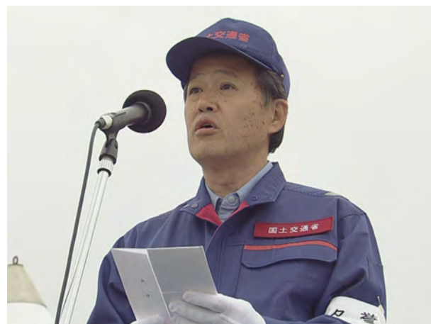
挨拶 名誉総裁 国土交通大臣