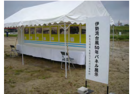
伊勢湾台風50年パネル展示