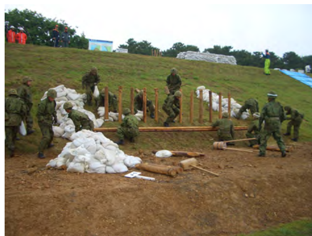
陸上自衛隊第10師団