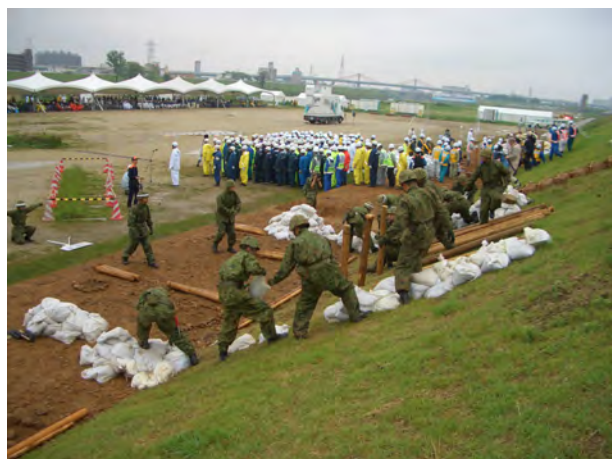
陸上自衛隊第10師団