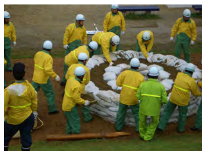
西区消防団連合会