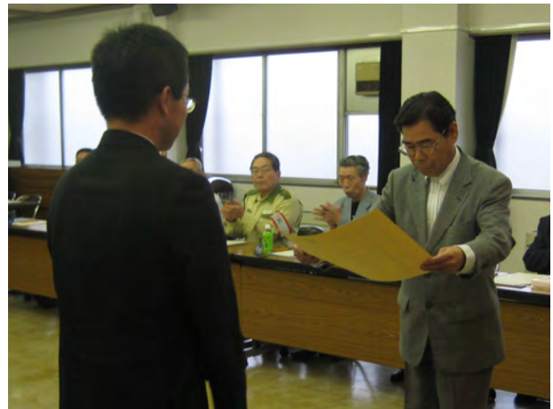
総指揮者(西区消防団連合会)