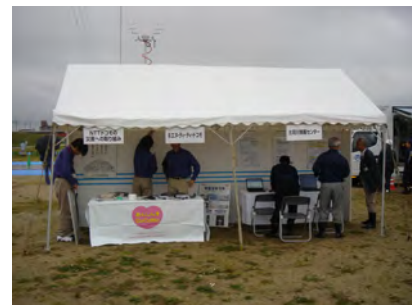
(株)エヌ・ティ・ティ・ドコモ (財)河川情報センター