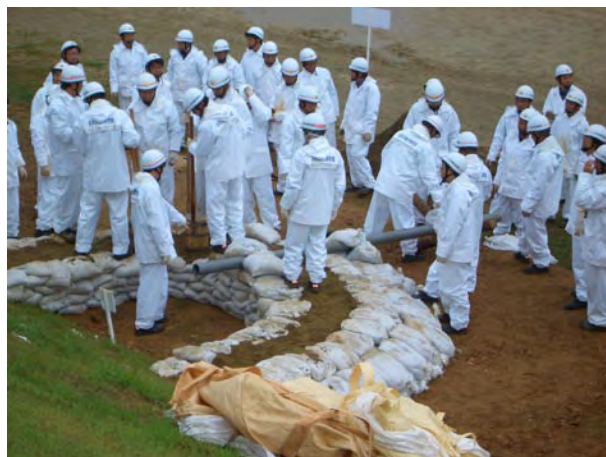
北名古屋市消防団