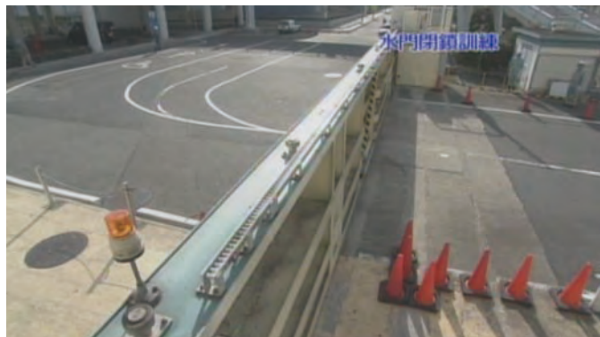
名古屋港陸閘閉鎖