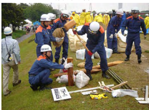
春日井市消防本部