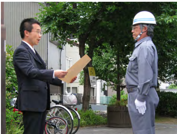
副指揮者(清須市消防団)