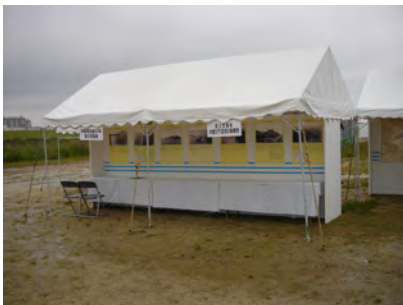
国土交通省木曾川下流河川事務所