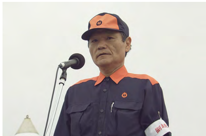
開会の辞 副統裁 愛知県建設部長