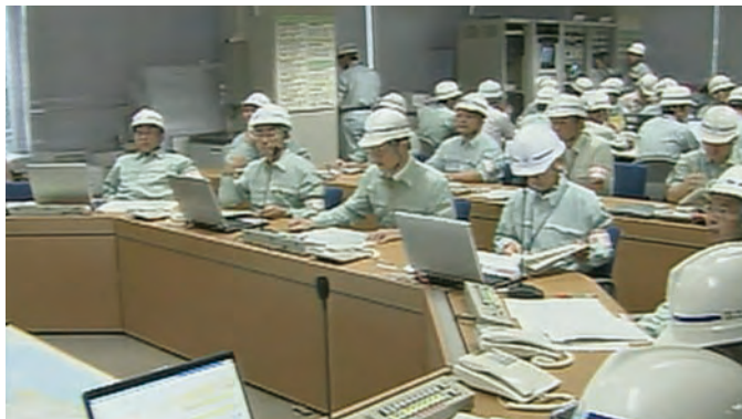
情報共有本部設置