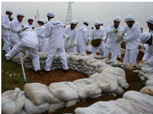
北名古屋市消防団