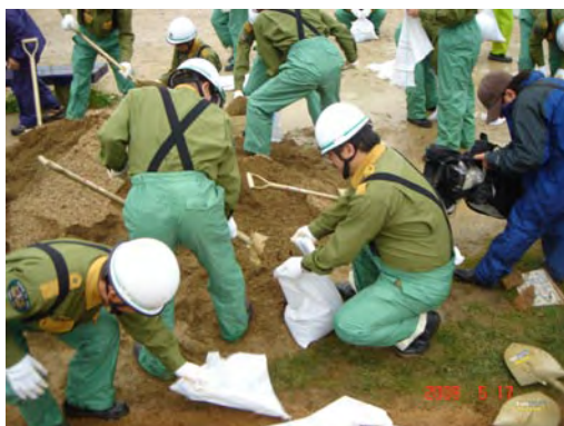
西区消防団連合会