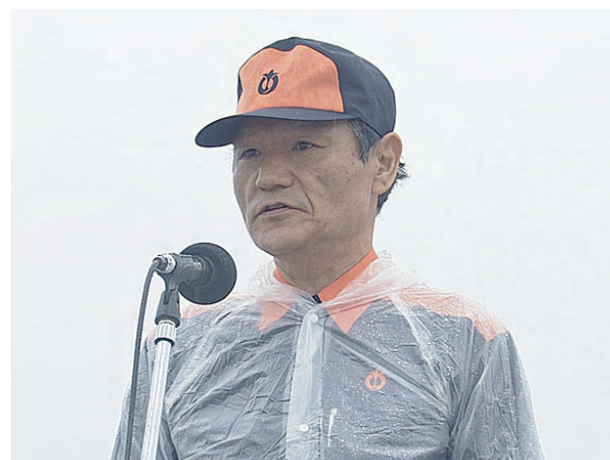
閉会の辞 副統裁 愛知県建設部長