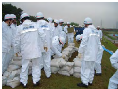
北名古屋市消防団