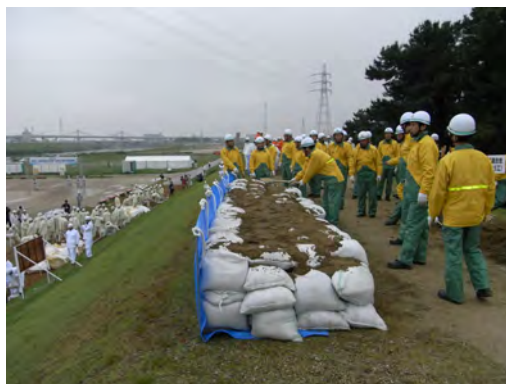
西区消防団連合会