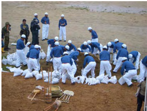
北名古屋市消防団