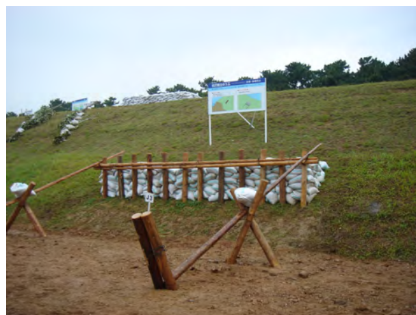
愛知県土木研究会、尾北建設協会