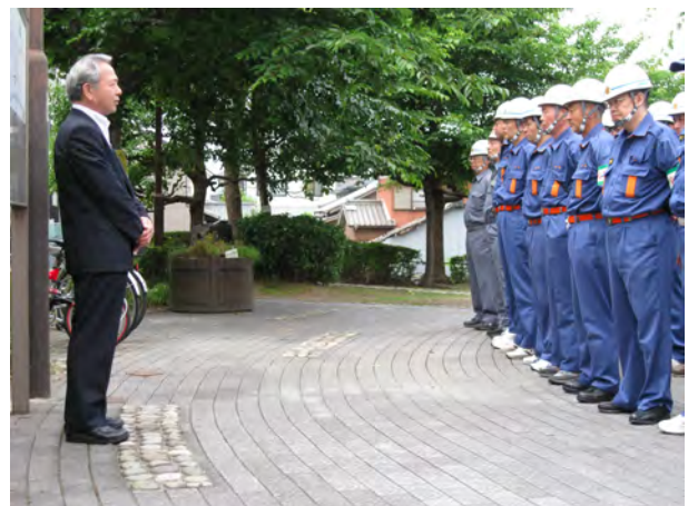
副指揮者(清須市消防団)