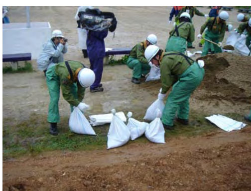
西区消防団連合会