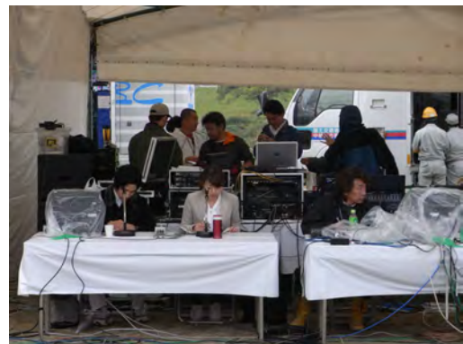
アナウンスブース