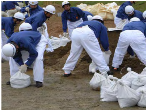
北名古屋市消防団