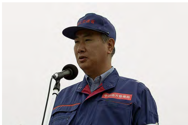
人員報告 総裁 国土交通省中部地方整備局長