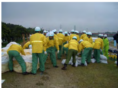
西区消防団連合会