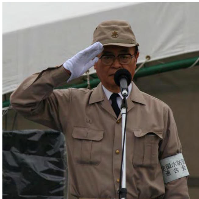
来賓挨拶 全国水防管理団体連合会長 陣内 孝雄様