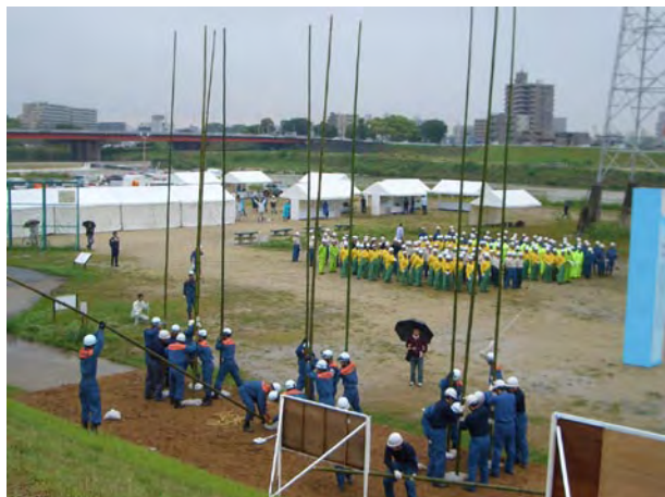
春日井市消防本部