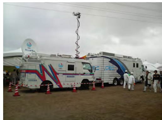
衛星通信車・中継車