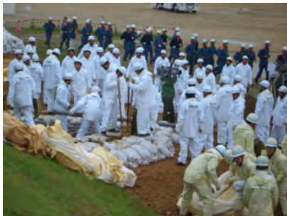
北名古屋市消防団