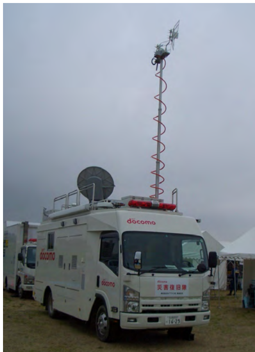
NTT docomo 災害復旧隊