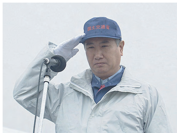
講評 国土交通省中部地方整備局長