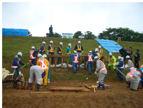
愛知県建設業協会、庄内川災害協力会