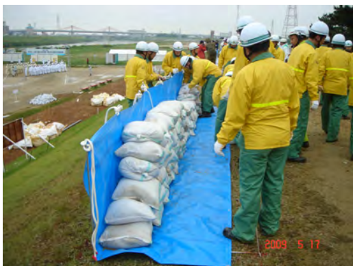
西区消防団連合会