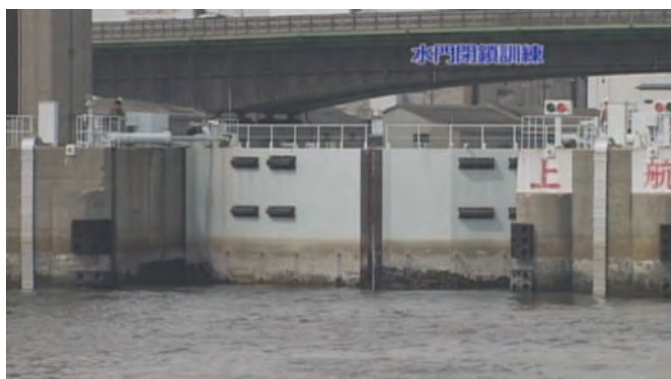
名古屋港水門閉鎖