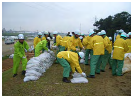
西区消防団連合会