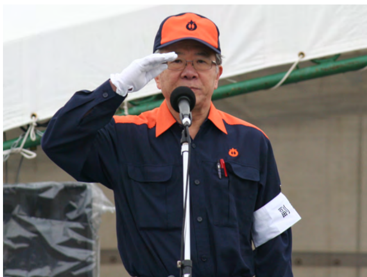
挨拶 副総裁 愛知県知事