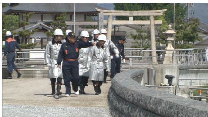
桑名市消防団 水門閉鎖&巡視