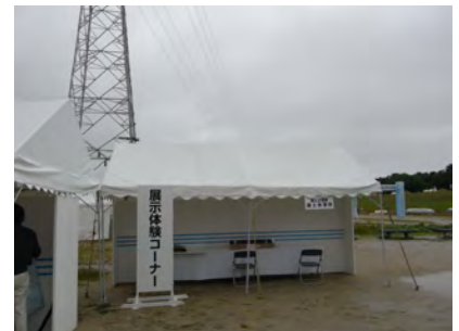
国土交通省国土地理院