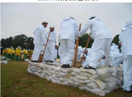
北名古屋市消防団