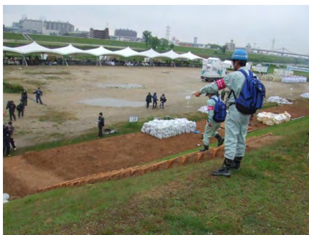
中部地方防災エキスパート