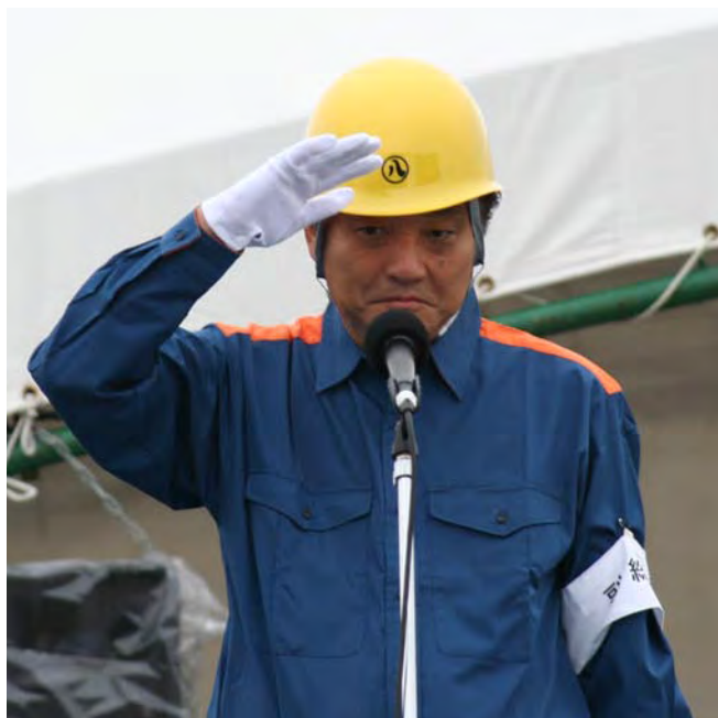
挨拶 副総裁 名古屋市長