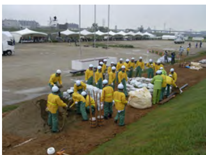
西区消防団連合会