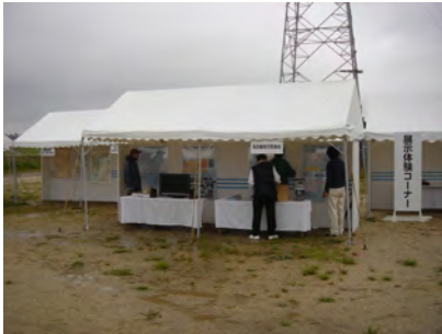
名古屋地方気象台