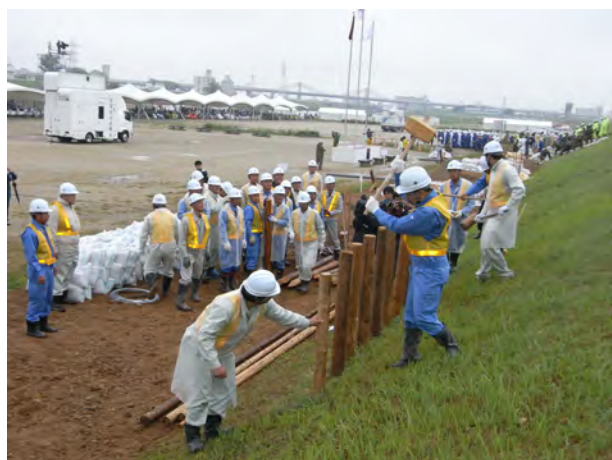
愛知県土木研究会、尾北建設協会