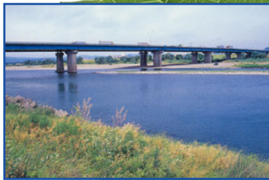
いつまでもきれいな水辺