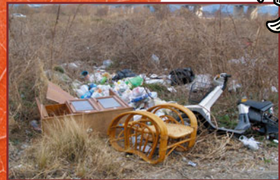
ますますゴミが増える