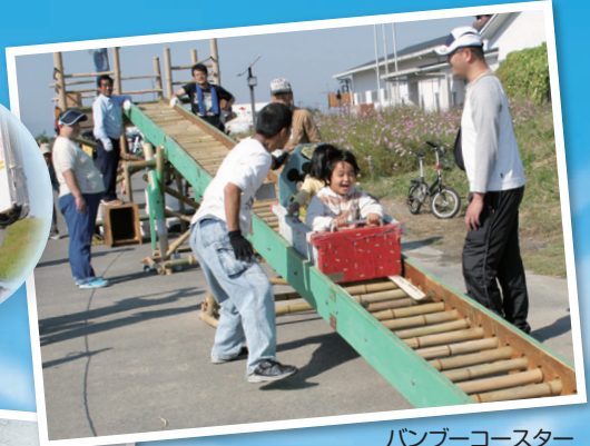
バンブーコースター