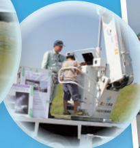
災害対策車の 展示