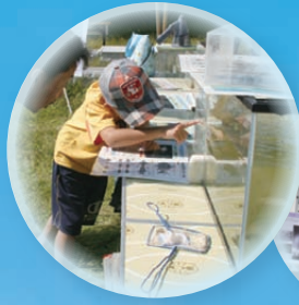
お魚観察 〈ガサガサ探検〉

庄内川・土岐川流域の文化・物産の交流と コミュニケーションの場として、 盛りだくさんの内容で開催します。 皆さまのご来場をお待ちしております。