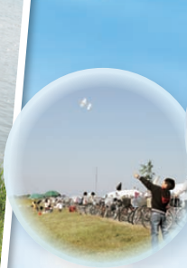
高く飛ば、紙飛行機