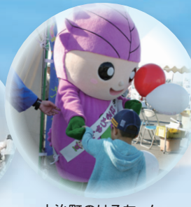
大治町のはるちゃん