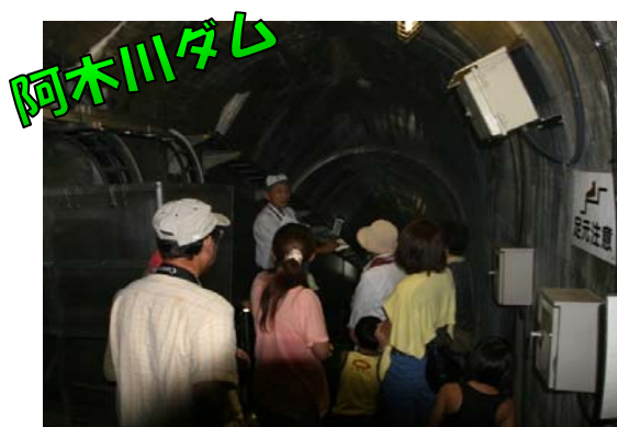
岩や土で造られたロックフィルダム・阿木川ダムの内部