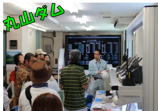
丸山ダムの操作室にはコンピュータがいっぱい