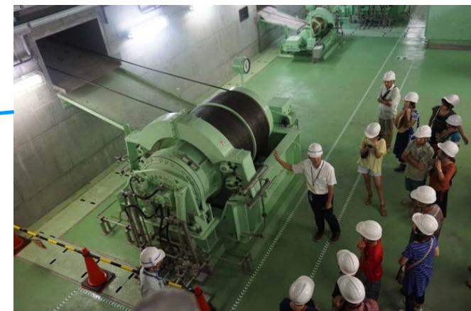
巨大なゲートの巻き上げ機を見学