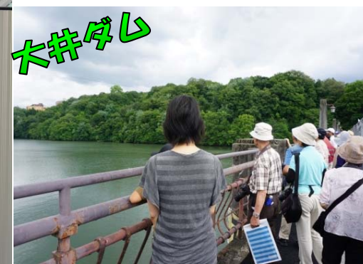
日本初のダム式発電所(大正13年完成)のある大井ダムの天端を歩く

※小学生以下は保護者同伴。定員15〜19人(コースにより異なる。応募数が多い場合は抽選)。参加費50円。申し込みは所定の申込書に必要事項を記入し、Eメールかファクスで、7月7日午後4時まで。申込書はホーム