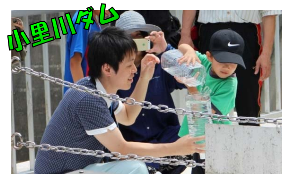
ペットボトルを使ってダムの仕組みを体験