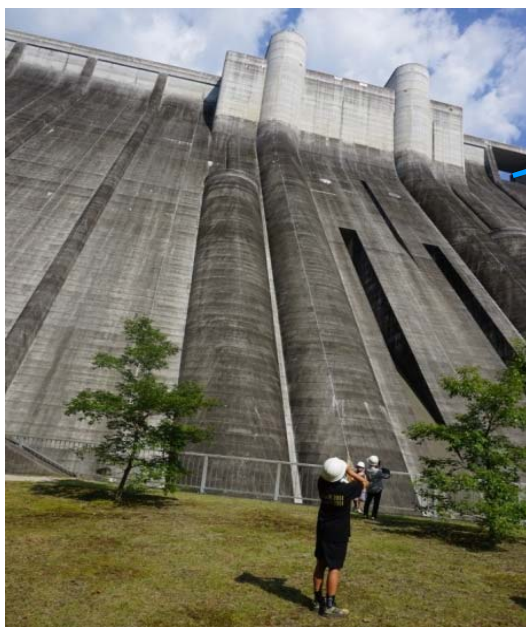
下から見上げるダムは迫力満点