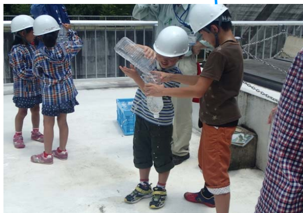
ペットボトルを使った防災操作の簡易実験