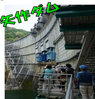
通廊からダムを見上げる