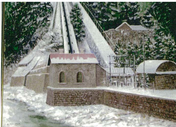
旧小里川第一発電所