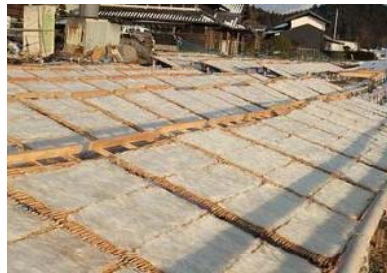
天日干しにされた細寒天