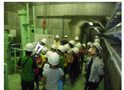
夏に行われた小学生の小里川ダム 見学の様子