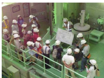
低水放流設備の見学