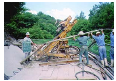
アンカー工事の様子