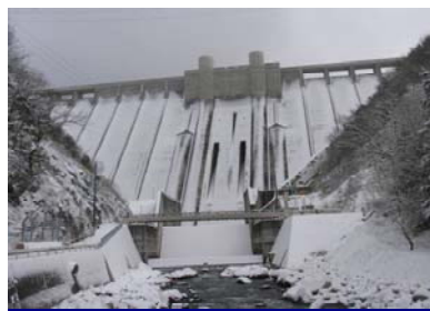
雪化粧をしたダム