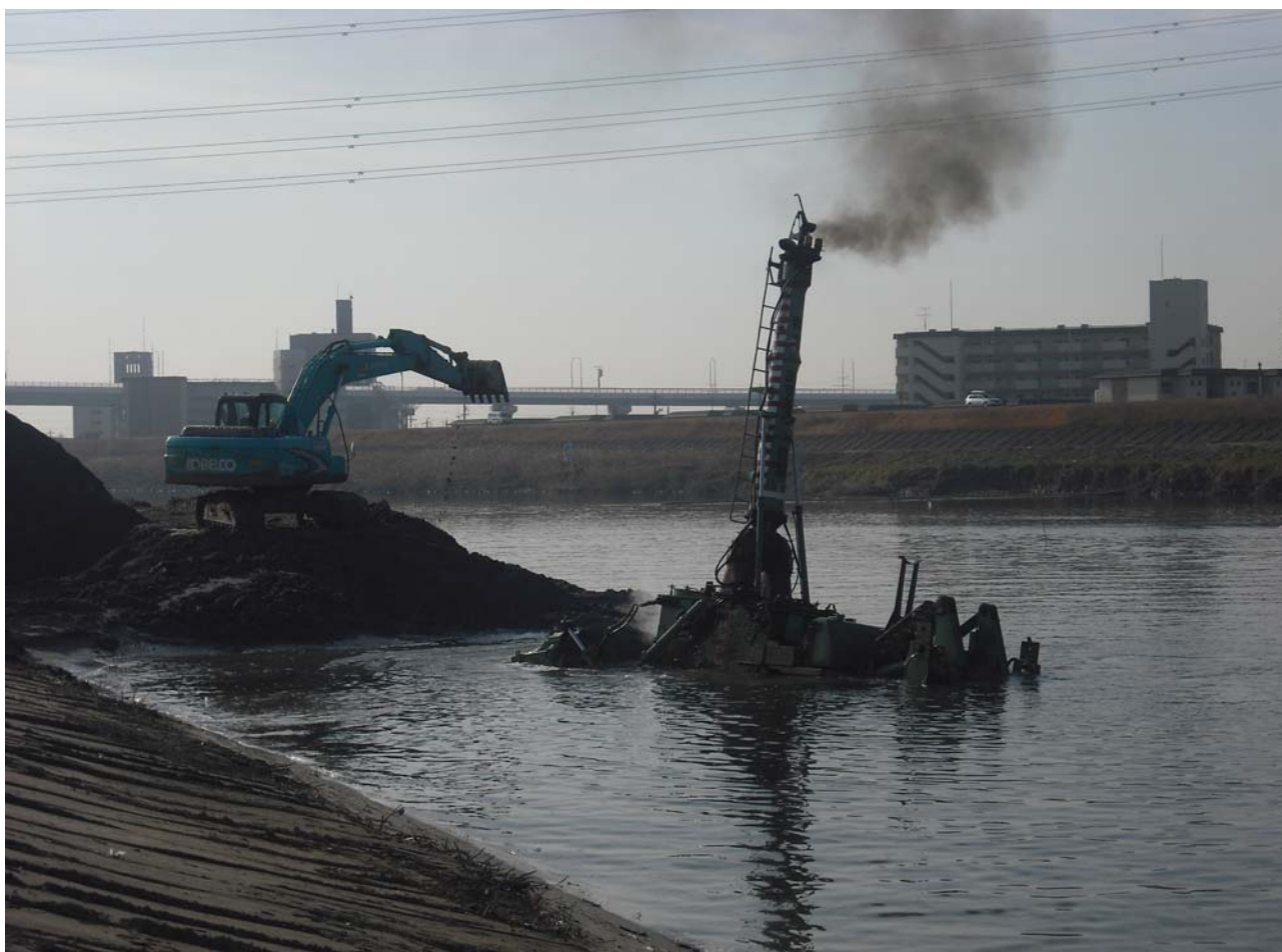
前シーズンの水中ブル活躍状況(H24.01.10撮影)