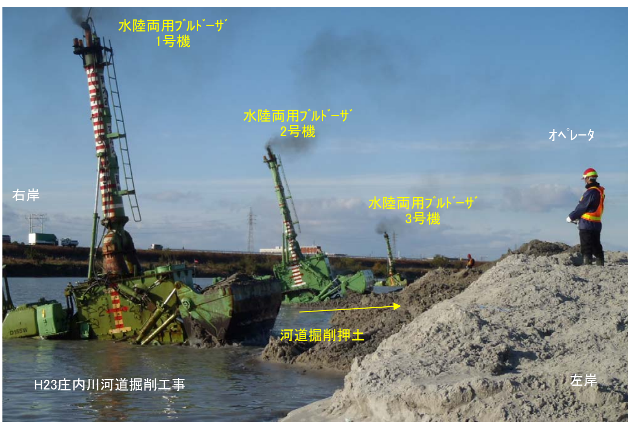
オペレータによるラジコン操作状況(前年度工事)