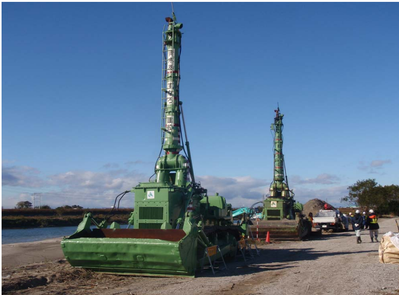
前シーズンの水中ブル組立後の状況(H23.11.25撮影)