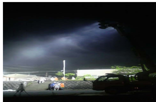
土岐の火災現場で活躍した照明車