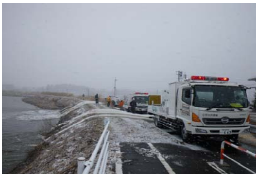
東日本大震災で活躍した排水ポンプ車