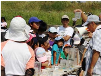
お魚ウォッチング