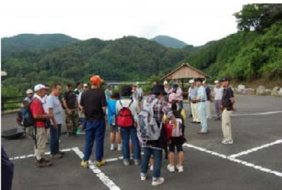
歓迎！地元の「里山教室」が案内

この日は、清須市が主催する上下流域交流イベント「庄内川上流域親子ふれあいツアー」もあって市民38名が庄内川の水源地である恵那市山岡町を訪れ、ユリの球根植え、小里川ダム湖のウォーキングなどをして地元の人たちと交流を深めていました。