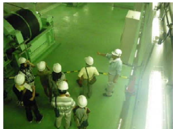
修理用ゲート(常用洪水吐ゲートを点検するためのもの)

この日は、清須市が主催する上下流域交流イベント「庄内川上流域親子ふれあいツアー」もあって市民38名が庄内川の水源地である恵那市山岡町を訪れ、ユリの球根植え、小里川ダム湖のウォーキングなどをして地元の人たちと交流を深めていました。