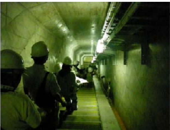
管理用通廊(長い階段)