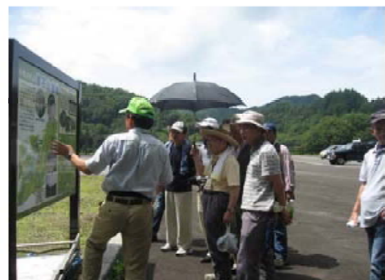
ウォーキングコースの説明