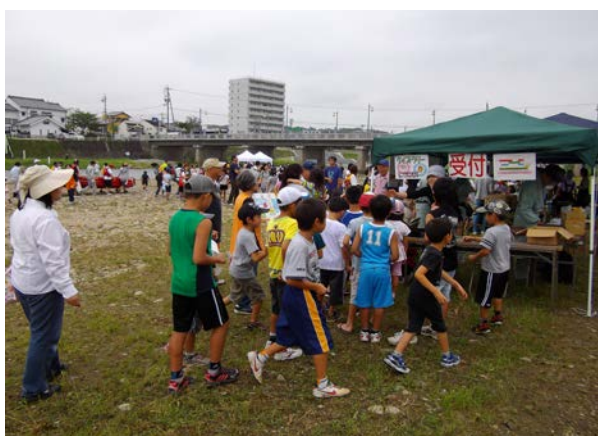
【クイズラリーの受付】