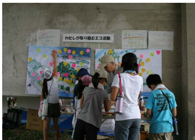
【川エコパネルの展示】