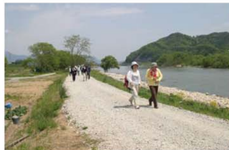
管理用道路をフットパスとして活用（最上川）