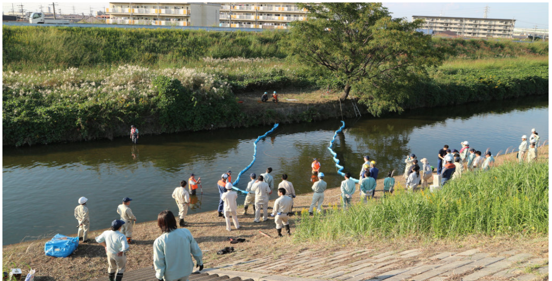
オイルフェンスの設置