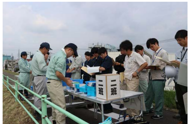
(バックテスト水質検査)