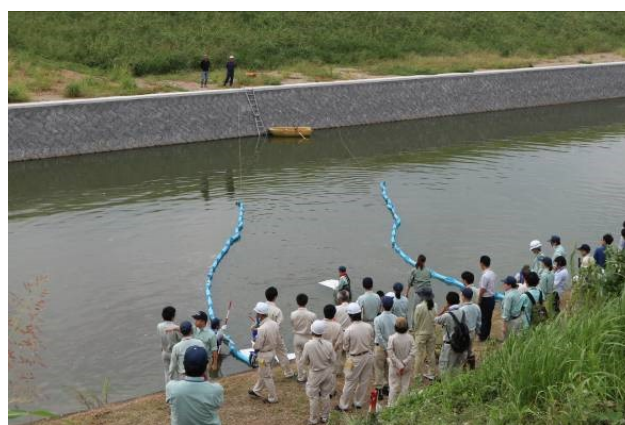
(オイルフェンス設置訓練)