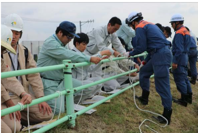
(ロープの結束訓練)