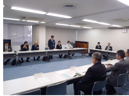
意見交換会の様子（名四国道事務所）