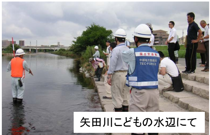
矢田川こどもの水辺にて