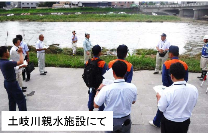
土岐川親水施設にて