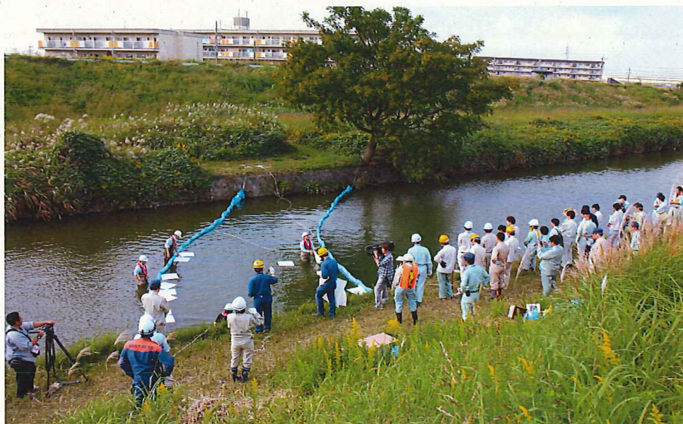
オイルフェンスの設置