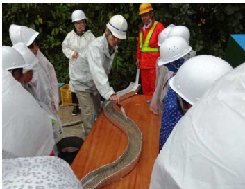
昨年度の川の学習の様子