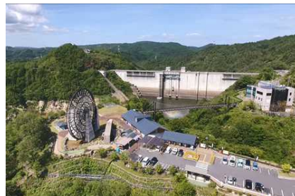
ドローンによる撮影のイメージ