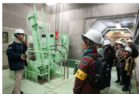
ダム堤体内部見学の様子