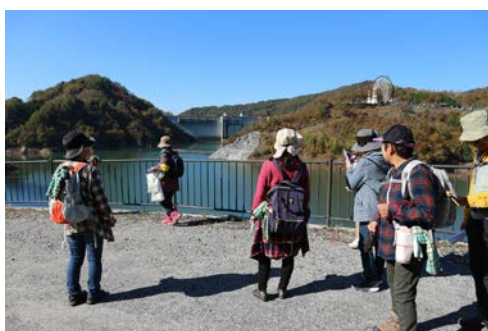
ウォーキングの様子