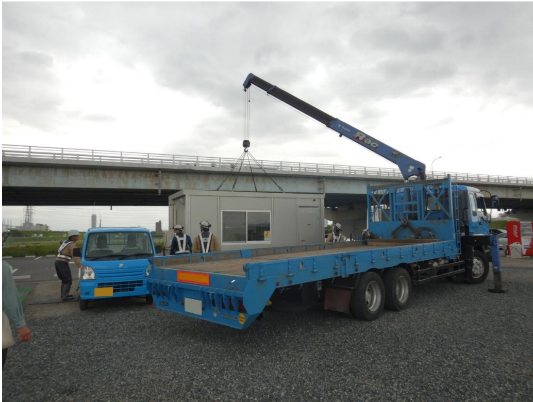
▲ユニットハウスの搬出