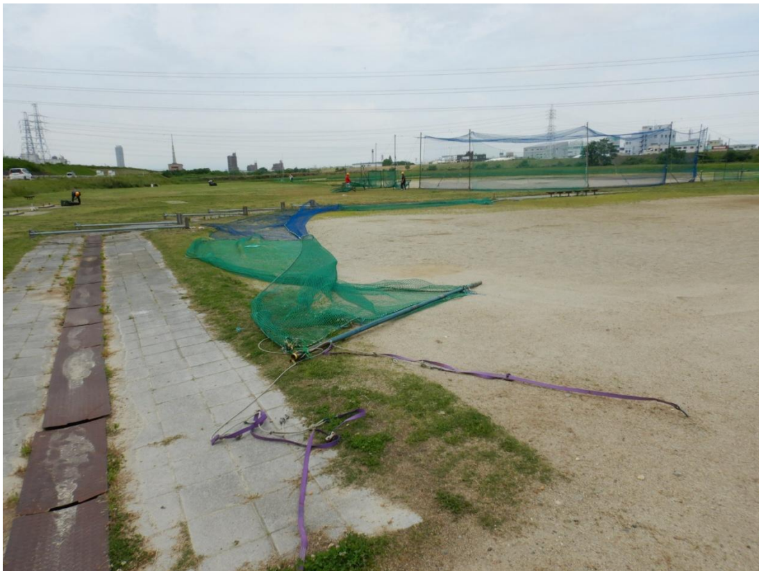
▲ネット用支柱の転倒