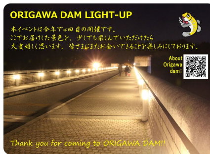
< 今年のライトアップカード 表面(左)・裏面(右) >