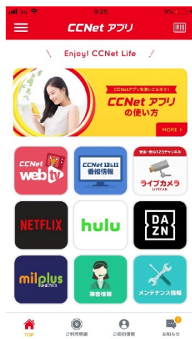
アプリトップ画面