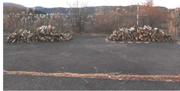
配布予定の伐採木の状況