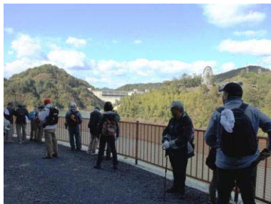
ウォーキングコースの様子