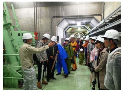
ダム堤体内部見学の様子