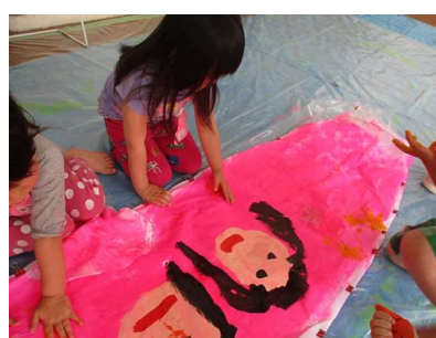
こいのぼり製作風景